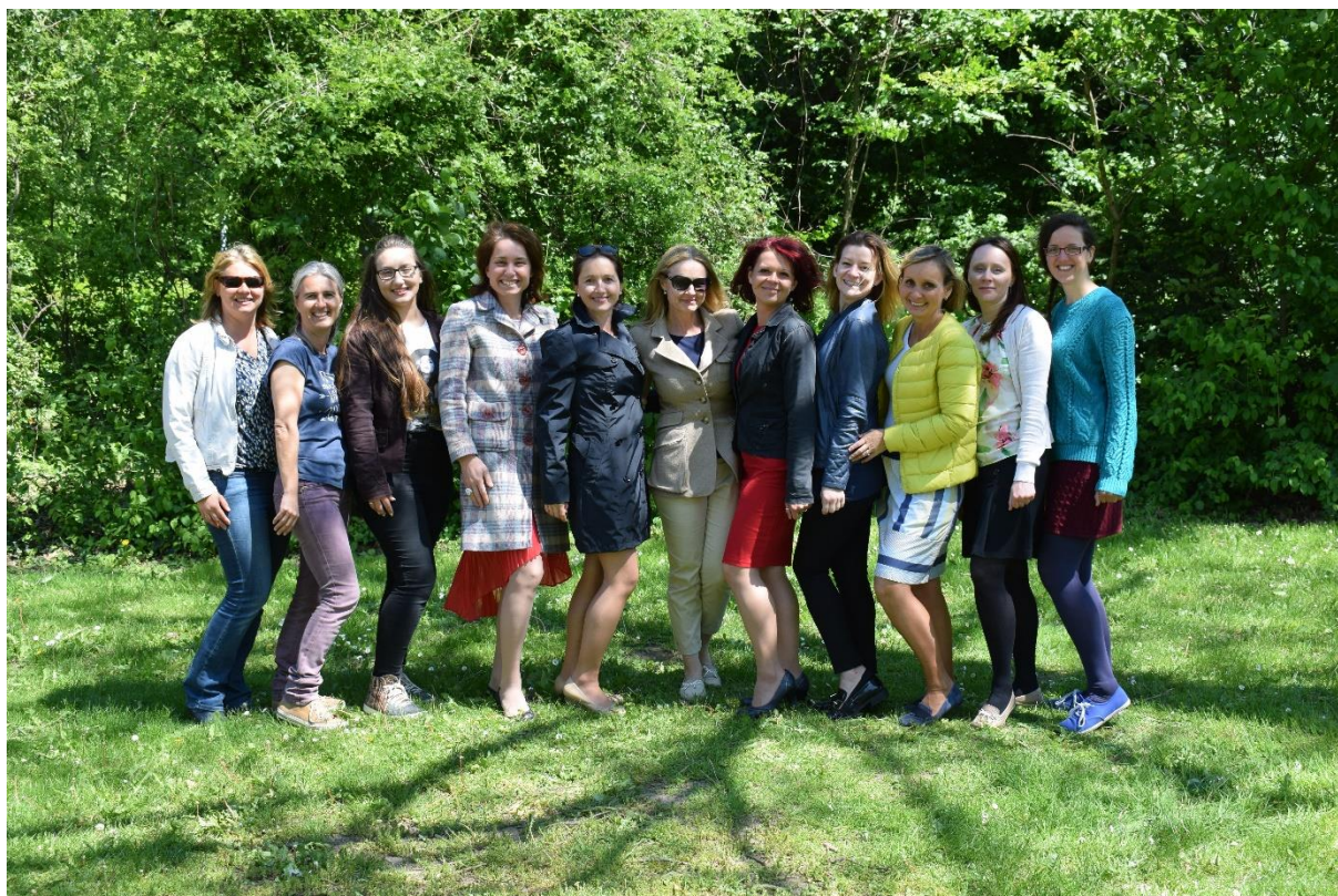
Vaše redakce a tým učitelek ČŠBH Ženeva

Krásné prázdniny a těšíme se na vás v příštím školním roce!